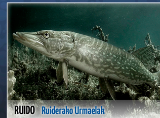
RUIDO Ruiderako Urmaelak

José Antonio Valverde | Espainia | 6 min.