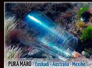
PURA MARO Euskadi - Australia - Mexiko