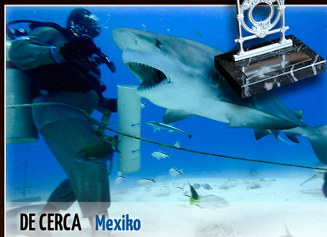
DE CERCA | Mexiko