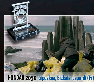
HONDAR 2050 Gipuzkoa, Bizkaia, Lapurdi (Fr)