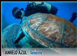
ANHELO AZUL Tenerife