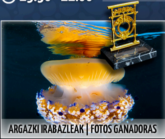
ARGAZKI IRABAZLEAK | FOTOS GANADORAS