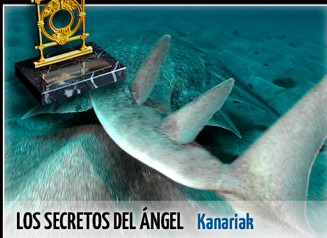
LOS SECRETOS DEL ÁNGEL | Kanariak