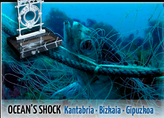
OCEAN'S SHOCK | Kantabria - Bizkaia - Gipuzkoa