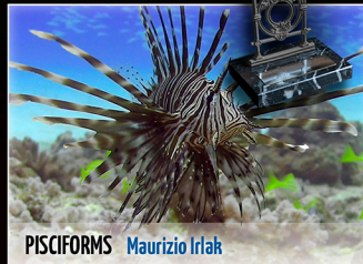
PISCIFORMS | Maurizio Iriak

Olivier Van den Broeck | Belgika | 11 min.