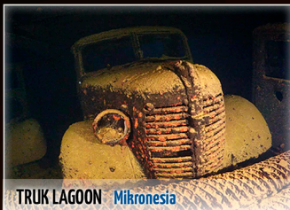
TRUK LAGOON | Mikronesia