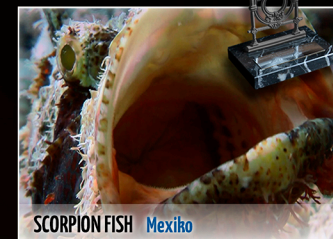
SCORPION FISH Mexiko