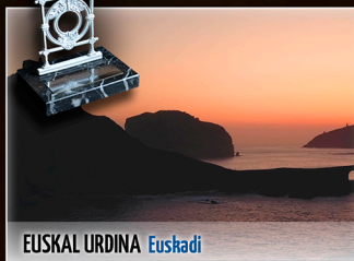
EUSKAL URDINA Euskadi