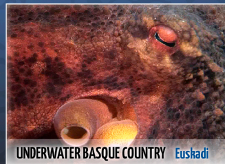
UNDERWATER BASQUE COUNTRY Euskadi

¿Quieres conocer los motivos reales por los cuales los buceadores nos mete- mos a las profundidades del mar? ¿Quieres conocer desde dentro cómo se pre- para una inmersión de buceo? ¿Qué vemos en aguas de nuestro Cantábrico para que una y otra vez volvamos a repetir esta experiencia? Ven y te desvela- remos nuestros secretos.