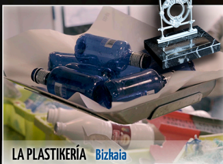
LA PLASTIKERÍA Bizkaia