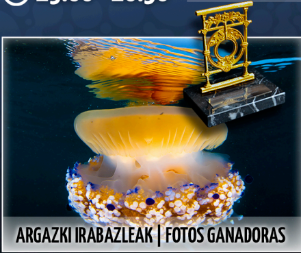
ARGAZKI IRABAZLEAK | FOTOS GANADORAS