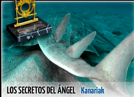
LOS SECRETOS DEL ÁNGEL | Kanariak