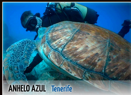
ANHELO AZUL Tenerife