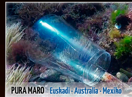
PURA MARO Euskadi · Australia · Mexiko