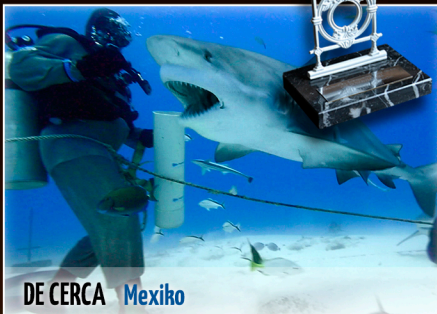
DE CERCA | Mexiko