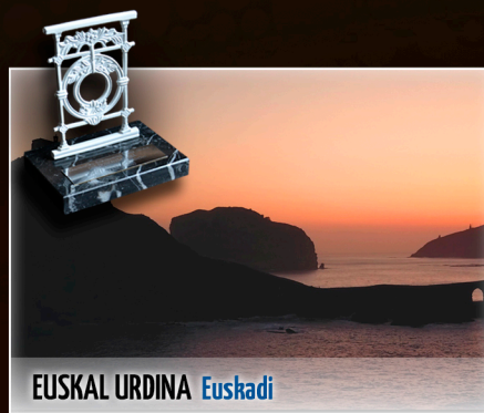
EUSKAL URDINA Euskadi