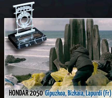
HONDAR 2050 Gipuzkoa, Bizkaia, Lapurdi (Fr)