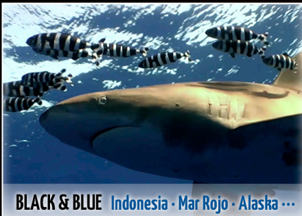
BLACK & BLUE | Indonesia · Mar Rojo · Alaska ···

Olivier Van den Broeck | Belgika | 11 min.