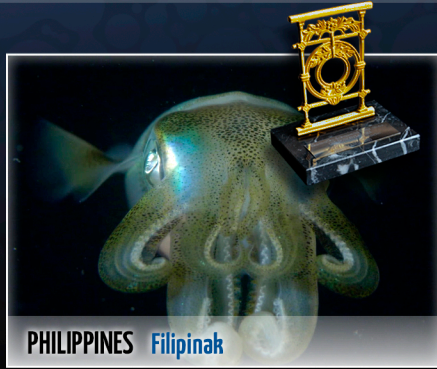
PHILIPPINES | Filipinak