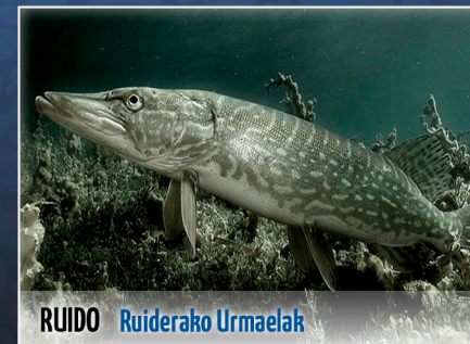
RUIDO Ruiderako Urmaelak

José Antonio Valverde | Espainia | 6 min.