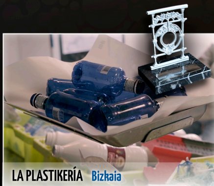
LA PLASTIKERÍA Bizkaia

¿Quieres conocer los motivos reales por los cuales los buceadores nos metemos a las profundidades del mar? ¿Quieres conocer desde dentro cómo se prepara una inmersión de buceo? ¿Qué vemos en aguas de nuestro Cantábrico para que una y otra vez volvamos a repetir esta experiencia? Ven y te desvelaremos nuestros secretos.