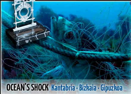
OCEAN'S SHOCK | Kantabria · Bizkaia · Gipuzkoa