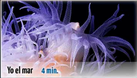
Yo el mar 4 min.