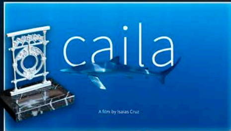
Isaias Cruz Irujo | 6 min. | Euskal kostaldea

Diaporama argazki hobereenarekin | Diaporama con las mejores fotografías | 6 min.