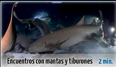
Encuentros con mantas y tiburones 2 min.