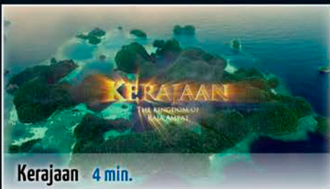
Kerajaan 4 min.