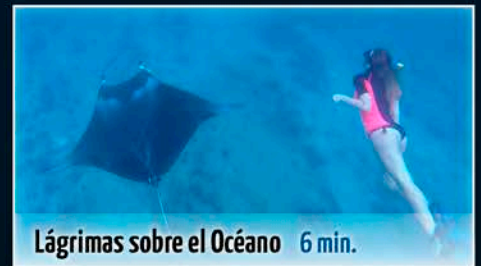
Lágrimas sobre el Océano 6 min.