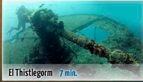
El Thistlegorm 7 min.