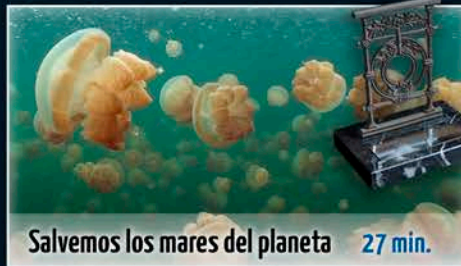
Salvemos los mares del planeta 27 min.