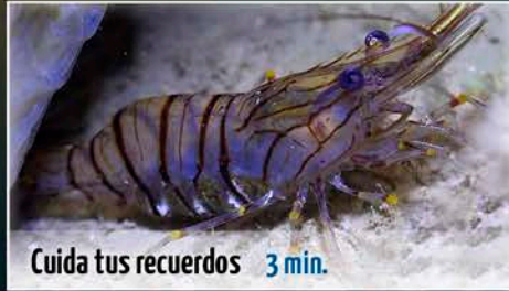
Cuida tus recuerdos 3 min.

Marc Pedrals Prat | Costa Brava - Medas y l'Escala