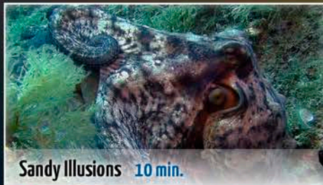
Sandy Illusions 10 min.