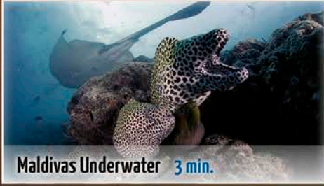
Maldivas Underwater 3 min.